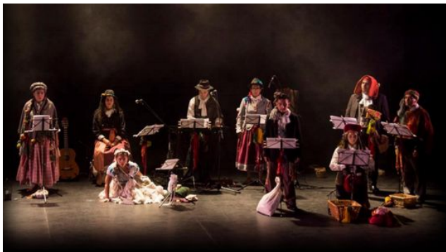
Elenco de la Obra "Chiwanku y los reyes. La batalla por el agua" Alcontraluz-Teatro

Principalmente creemos en que debemos ser consecuentes con el mensaje que enviamos a través de la obra y, por eso, decidimos que los elementos que la construyeran tuvieran la misma línea: sostenibilidad. Así, nos encargamos de que todo lo que es la escenografía o la vestimenta viniera de objetos que ya teníamos o la búsqueda de objetos ya usados. Por ejemplo, nuestras vestimentas fueron hechas a partir de ropa usada o prendas que no ocupábamos y transformamos para la obra.