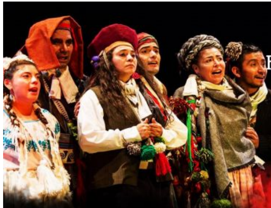
Obra "Chiwanku y los reyes. La batalla por el agua" Alcontraluz-Teatro

El teatro es una fuente interdisciplinar en todo sentido, que abarca demasiados elementos y enseña el trabajo en equipo. De cierto modo, te prepara para la vida y es por ello que los colegios deben tomar el peso de entregar una oferta educativa que permita la exploración de estos.