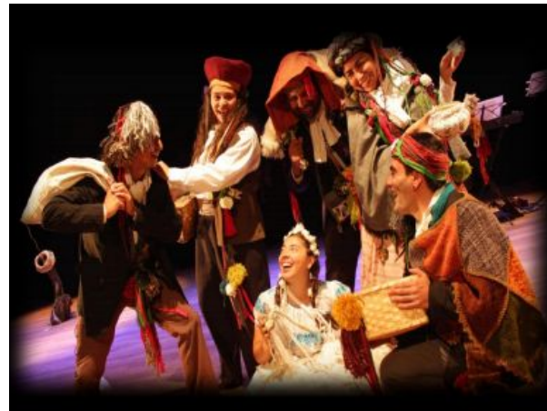
Obra "Chiwanku y los reyes. La batalla por el agua" Alcontraluz -Teatro

No existe una respuesta y mientras más pasa el tiempo, este problema se vuelve más visible y contingente. Debemos actuar ahora y comunicar esto para tomar consciencia de lo fuerte de este problema. Esto también se ve reflejado en que nadie gana o pierde dentro del desarrollo de la obra misma, sino que sigue pasando el tiempo mientras la problemática permanece, de cierto modo ese es el mensaje que hay que transmitir: es un llamado a pensar esto del agua y poner énfasis en ello. Básicamente si se acaba el agua nos morimos y aun así no hacemos nada.